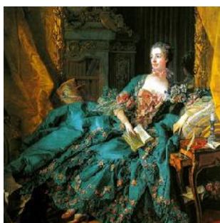
Retrato de Madame de Pompadour, François Boucher Ca. 1756 Pinacoteca Antigua de Múnich, Alemania