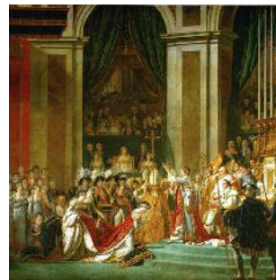
La consagración de Napoleón, Jacques- Louis David Ca. 1805-1809 Museo del Louvre, París, Francia