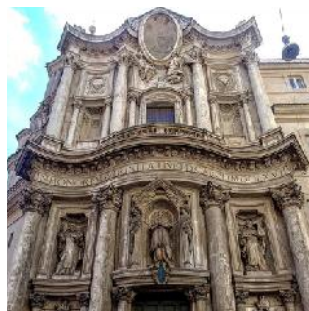
Iglesia de San Carlo alle Quattro Fontane, Francesco Borromini. Ca. 1430 Roma, Italia