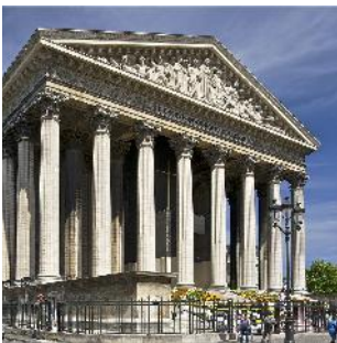
La Madeleine, Ca. 1806-1842 París, Francia