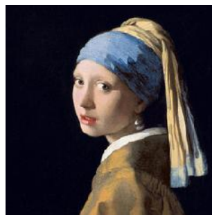
La joven de la perla, Johannes Vermeer Ca. 1666 Museo Mauritshuis, La Haya, Países Bajos