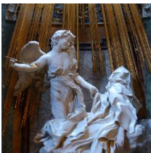
El éxtasis de Santa Teresa, Gian Lorenzo Bernini Ca. 1652 Santa María de la Victoria, Roma, Italia