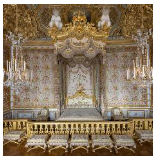
Cámara de la Reina, Palacio de Versailles 1661-1780 Versailles, Francia