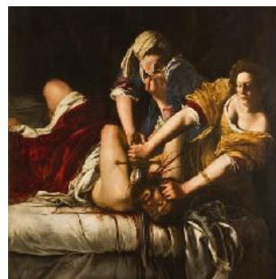
Judit decapitando a Holofernes, Artemisia Gentileschi. Ca. 1613 Florencia, Italia