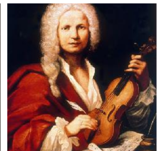
Las cuatro estaciones, Antonio Vivaldi Ca. 1720-1721