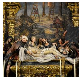
Entierro de Cristo, Bernardo Pineda Ca. 1670 Iglesia de la caridad, Sevilla, España