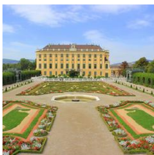
Palacio de Schönbrunn, Johann Bernhard Fischer von Erlach Ca. 1701 Viena, Austria