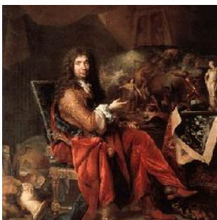
Charles Le Brun Academia y Manufactura Real de Francia Ca. 1648