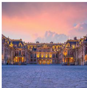
Palacio de Versailles, Ca. 1661-1780 Versailles, Francia