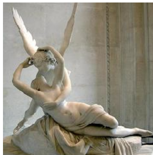
Eros y Psique, Antonio Canova Ca. 1793 Museo del Louvre, París, Francia